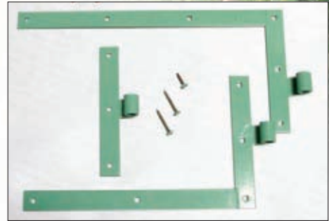
Laquage ferrage RAL au choix