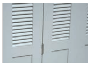
Détail paumelles inox