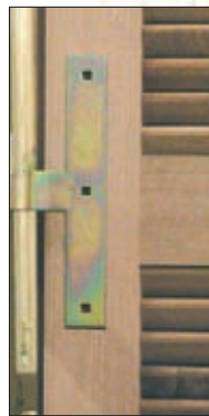
Penture encastrée (option)