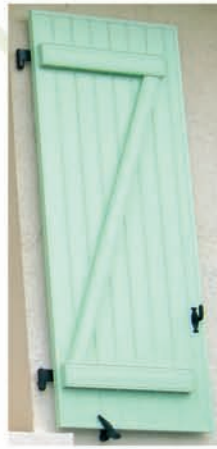
Barre et écharpe