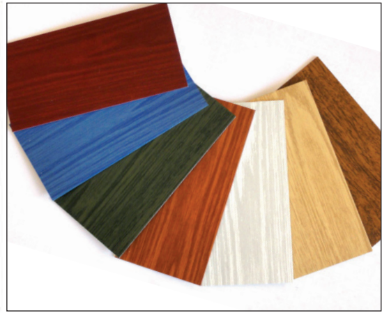
Nuancier décors bois