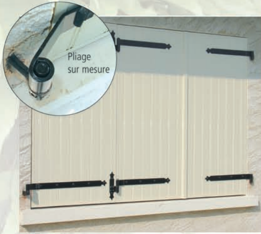
Modèle 3 vantaux