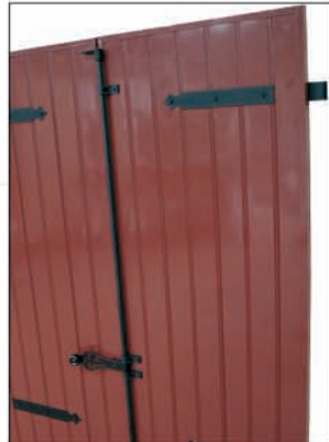
Penture et contre-penture