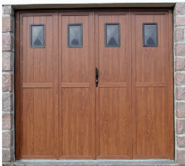
Porte KIUZO 38 chêne doré (vue extérieure)