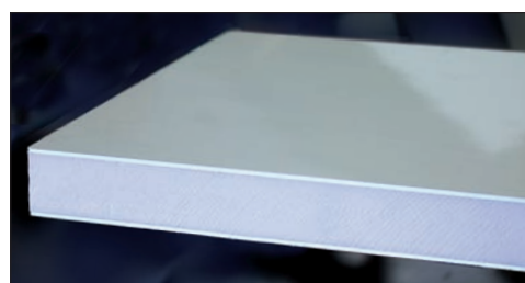
panneau PVC isolé, 2 faces lisses