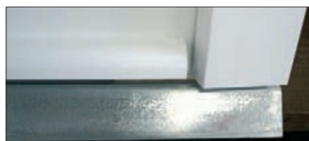
Seuil bas galvanisé et jet d'eau clipsé blanc ou chêne doré