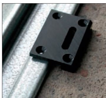
Gache PE basse