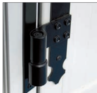
Gond œil extrudé

Afin d'apporter plus de clarté, nous vous proposons en option des hublots polycarbonate ou des parties hautes vitrées par un double vitrage isolant 24 mm. La hauteur de clair de vitrage est fixée à 300 mm entre traverse.