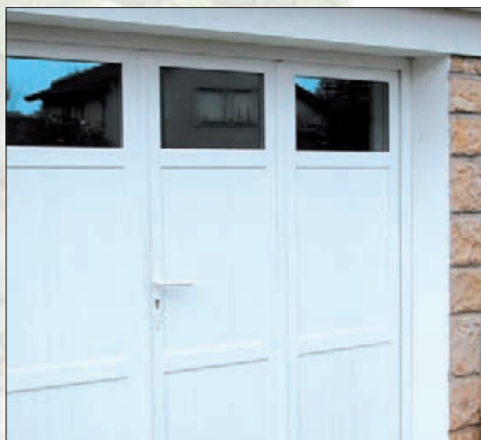
Avec partie haute vitrée DV 20mm