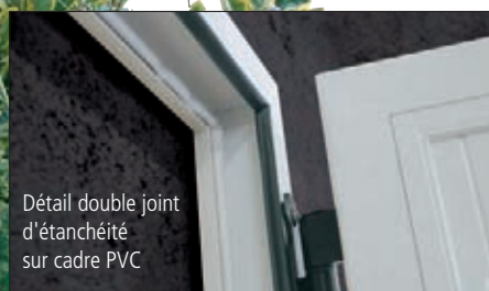
Détail double joint d'étanchéité sur cadre PVC