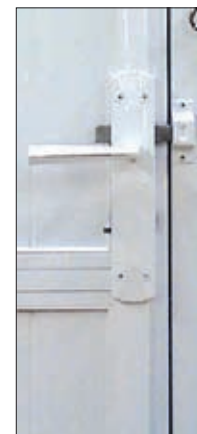
Serrure Alu carénée