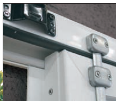
Détail gache serrure