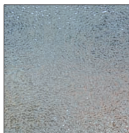
Vitrage GR200 44/2