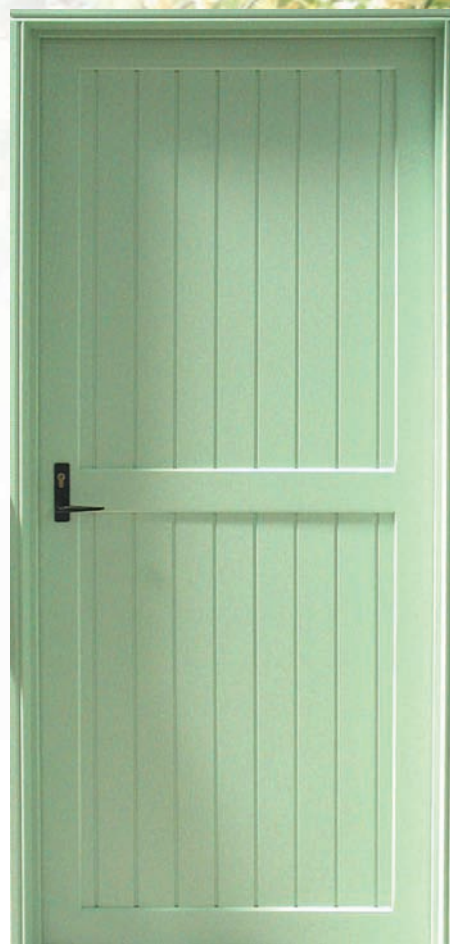
Porte de service 1 VT / RAL 6021