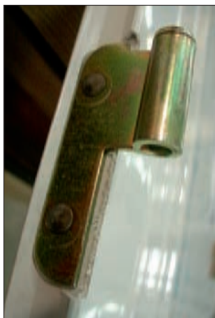
Paumelle rivetée (24 mm)

Les panneaux semi-fixes reçoivent des crémones à boucles. L'ensemble s'articulant sur un cadre bois périphérique 3 côtes de section 64 x 58 épaisseur avec joint d'étanchéité, seuil bas galvanisé, cales PE de maintien en position fermée.