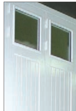
Partie haute vitrée 44/2

Coloris bois : nombreux coloris RAL disponibles (nous consulter).