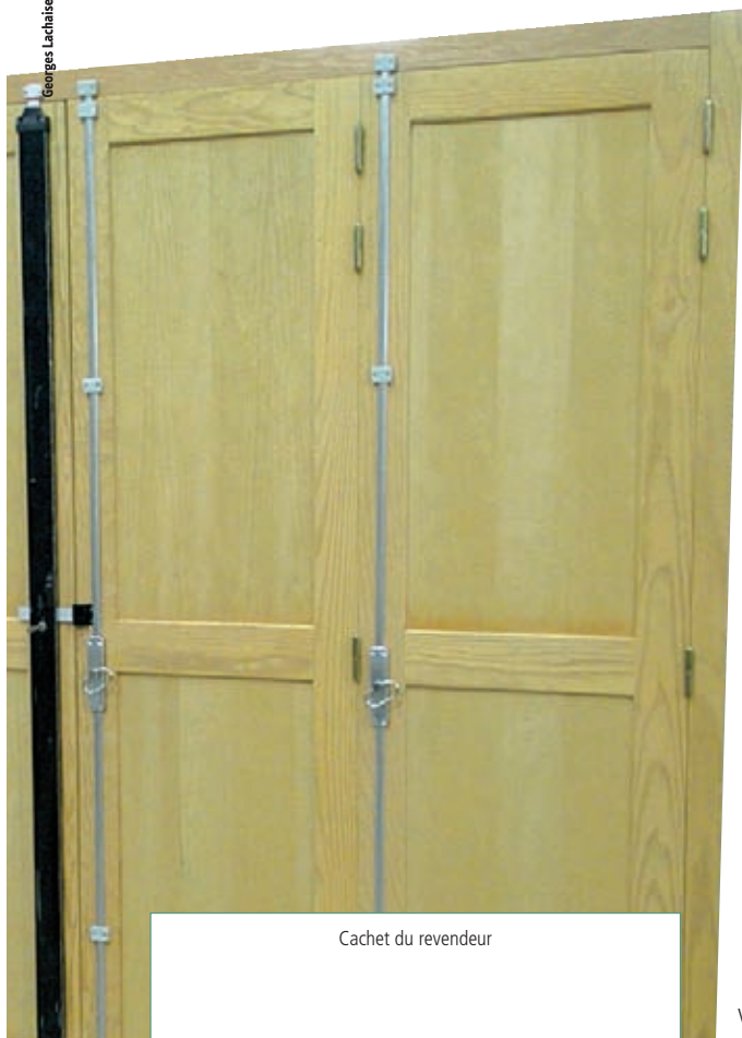
Cachet du revendeur