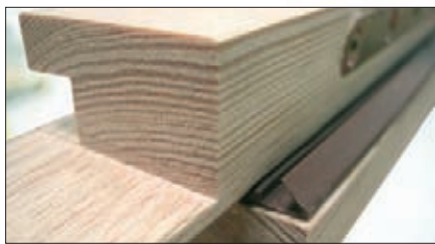
Cadre bois joints 24/31 mm