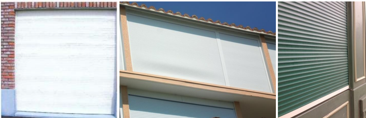
Figure 1 – Ondulation du Tablier de volets roulants

Les volets roulants, lorsqu'ils sont déployés, peuvent parfois présenter un aspect ondulé. Ce phénomène est accentué sur pour les produits de grandes dimensions (largeurs et hauteurs).